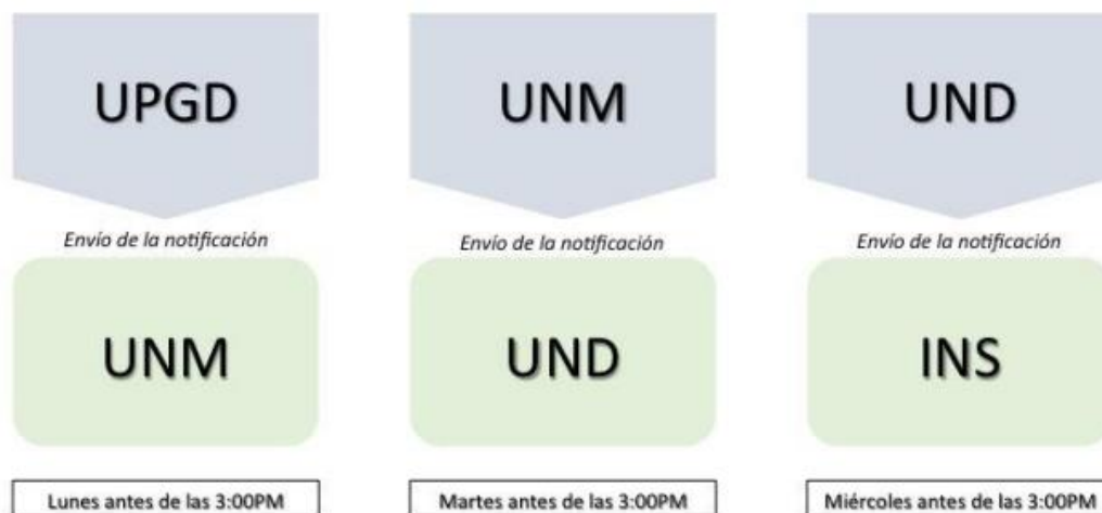
Gráfica No 1. Notificación semanal de EISP

Todos los integrantes del sistema de vigilancia en salud pública, que generen información de interés, deberán realizar la notificación de aquellos eventos de reporte obligatorio definidos en los modelos y protocolos de vigilancia, dentro de los términos de estructura de datos, responsabilidad, clasificación, periodicidad y destino señalados en los mismos y observando los estándares de calidad, veracidad y oportunidad de la información notificada. Para tal fin, el flujo de la información debe cumplir con los tiempos establecidos en cada nivel, establecidos (ver gráfica 1).