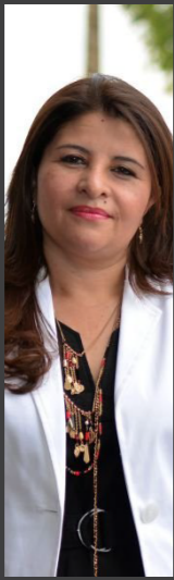
SECRETARÍA DE EDUCACIÓN