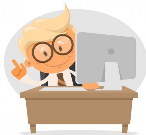
Gráfica 1: Estructura del curso virtual “Learn English Pathways”

Cada uno de los niveles explora contenidos que contribuyen al mejoramiento de las habilidades en inglés de forma práctica.