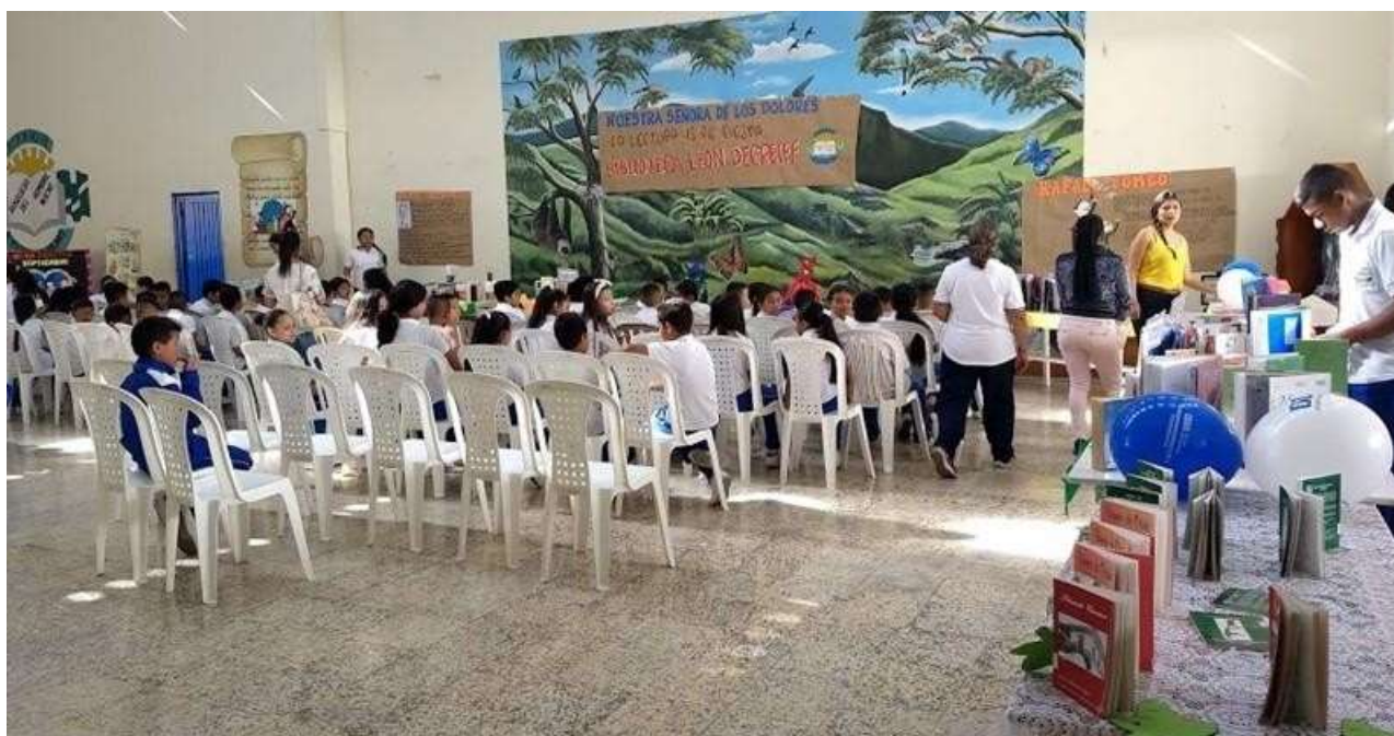
Compra y entrega de instrumentos musicales para la banda del colegio