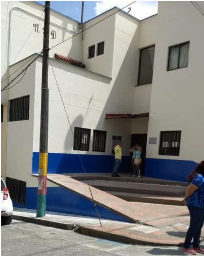
Embellecimiento de fachadas sede Salvador Duque