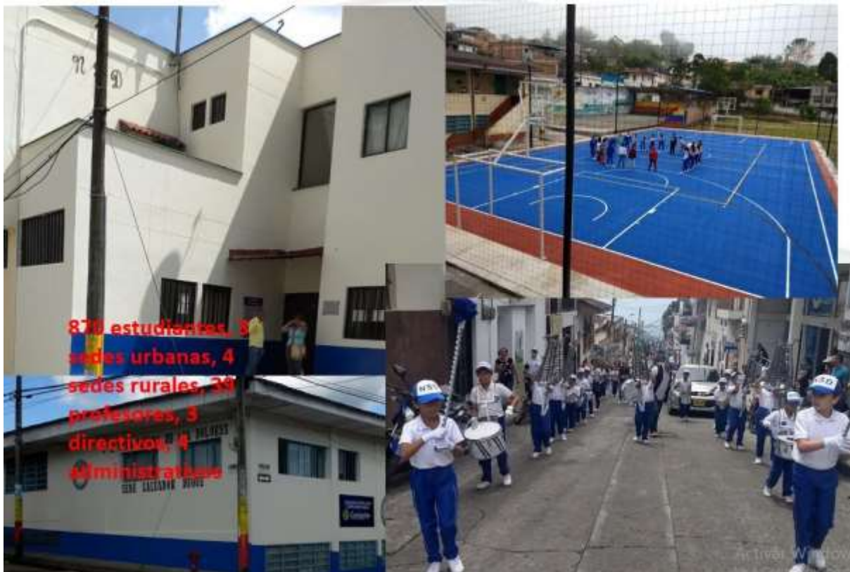
Fotos: fachadas restauradas, nueva cancha y muestra de la banda músico marcial

Componentes: GESTIÓN ACADEMICA, GESTION DIRECTIVA, RELACION CON LA COMUNIDAD, y Gestión Financiera (EJECUCION DEL PRESUPUESTO DE INGRESOS y GASTOS A 31 de DICIEMBRE de 2019, y RELACION DE CONTRATOS)