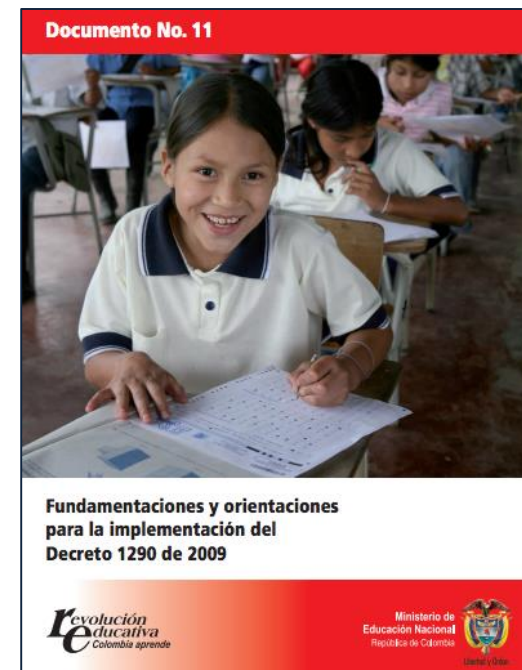
Documento 11: Fundamentaciones y orientaciones para la implementación del Decreto 1290 de 2009. Página 24.