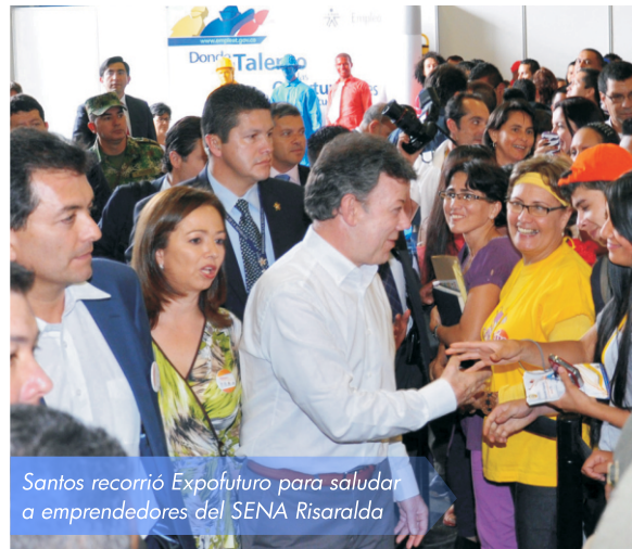
Santos recorrió Expofuturo para saludar a emprendedores del SENA Risaralda

“Quiero felicitar al Gobernador Carlos Botero, por su papel como representante de todos los departamentos, ya que ha sido muy efectivo y constructivo, porque su capacidad de convocatoria y de coordinación y su diálogo con el Gobierno Nacional, ha sido ejemplar, por eso los resultados de esa gestión ya se están viendo, afortunadamente en hechos concretos”, explicó el Presidente.