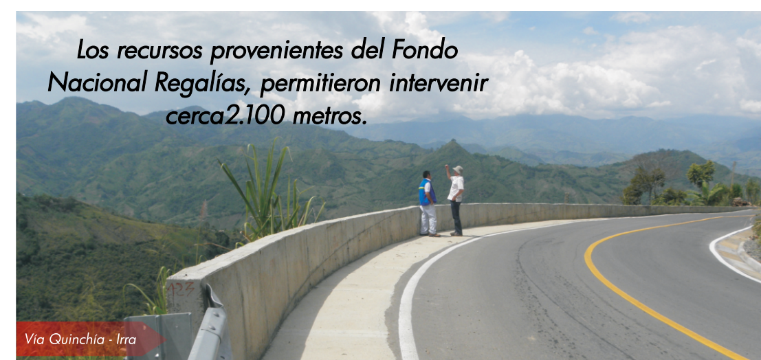
Vía Quinchía - Irra

Los recursos provenientes del Fondo Nacional Regalías, permitieron intervenir cerca 2.100 metros.