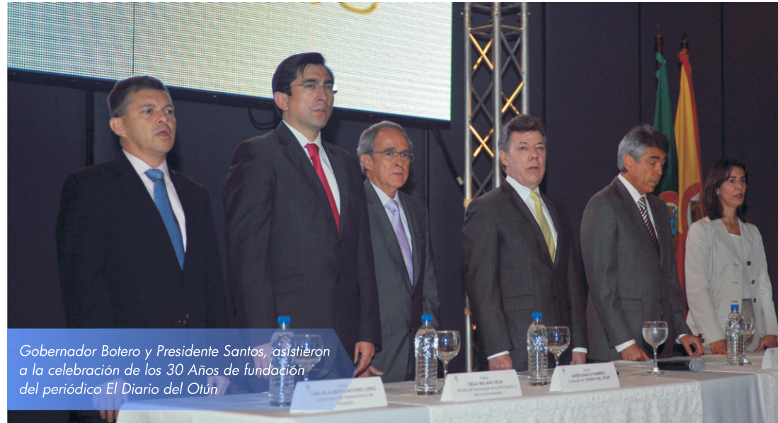
Gobernador Botero y Presidente Santos, asistieron a la celebración de los 30 Años de fundación del periódico El Diario del Otún

“Quiero felicitar al Gobernador Carlos Botero, por su papel como representante de todos los departamentos, ya que ha sido muy efectivo y constructivo, porque su capacidad de convocatoria y de coordinación y su diálogo con el Gobierno Nacional, ha sido ejemplar, por eso los resultados de esa gestión ya se están viendo, afortunadamente en hechos concretos”, explicó el Presidente.