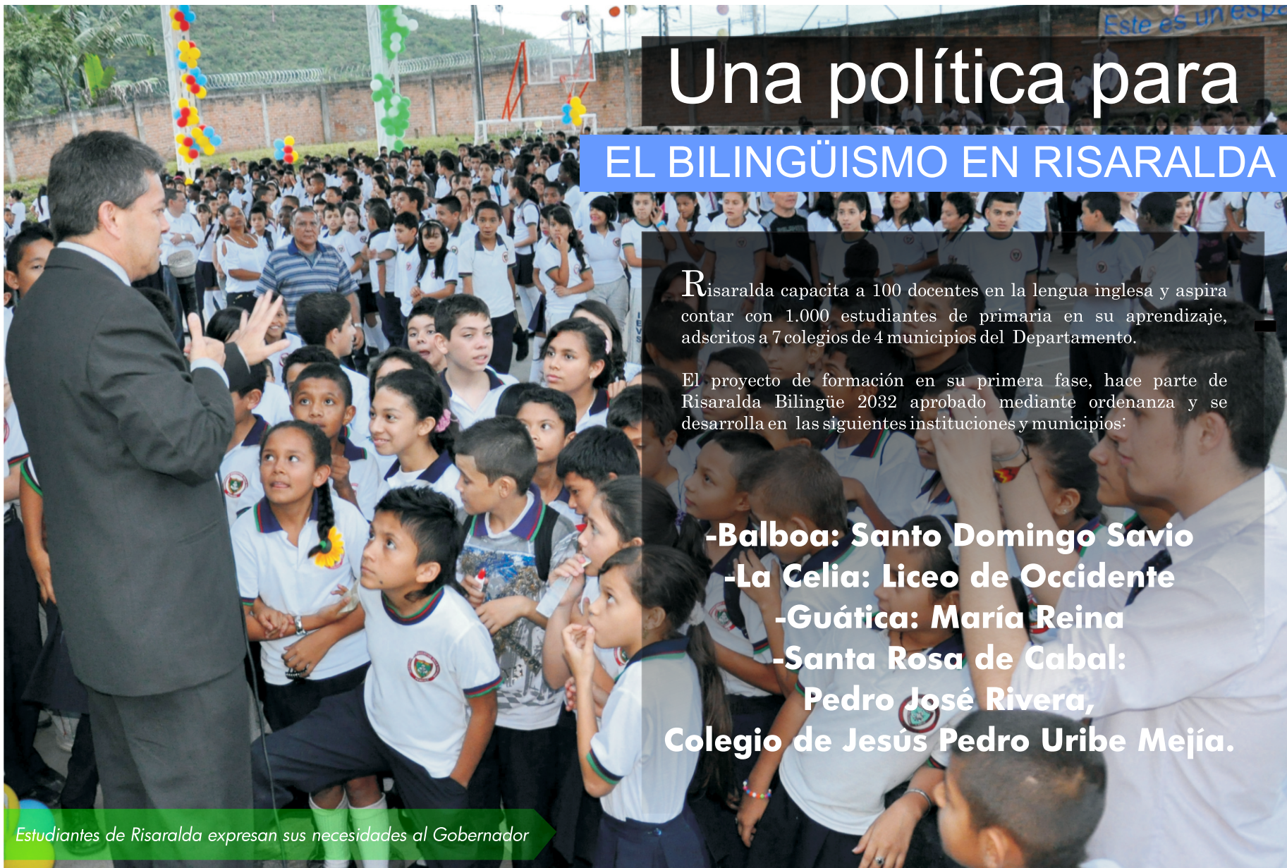
Estudiantes de Risaralda expresan sus necesidades al Gobernador