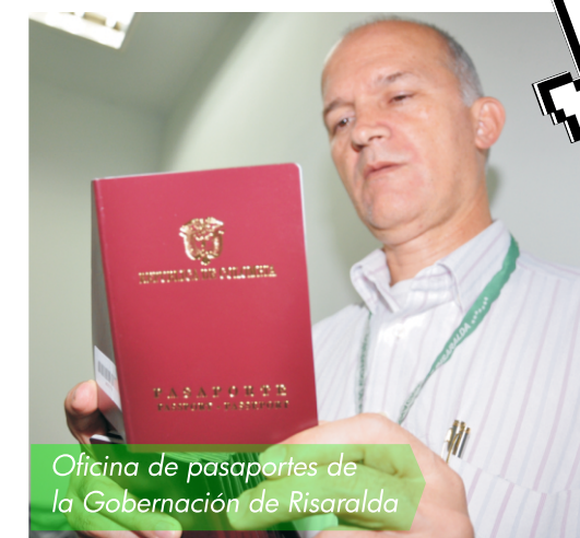
Oficina de pasaportes de la Gobernación de Risaralda

Desde el mes Abril que se implementó el servicio de agendamiento para pasaporte por Internet, se han generado 5.000 citas para solicitar este documento.