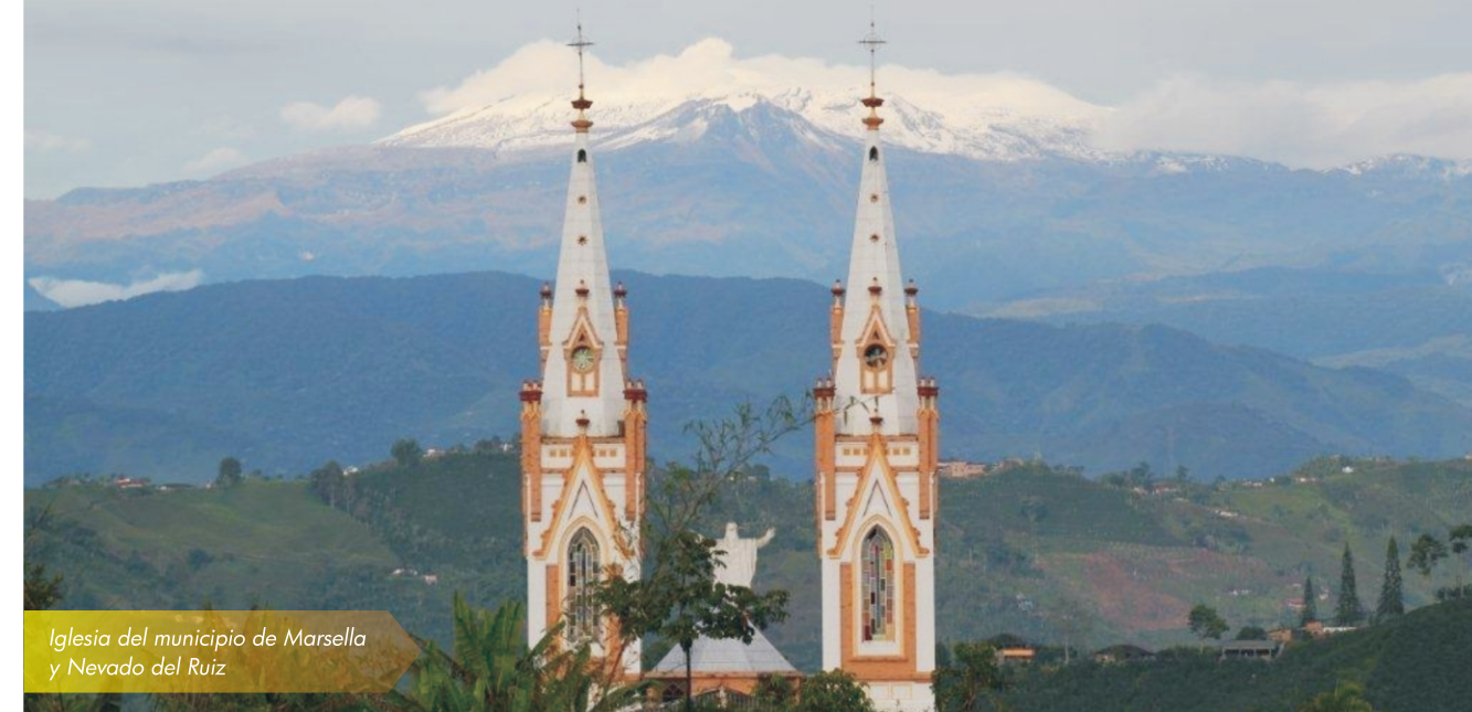
Iglesia del municipio de Marsella y Nevado del Ruiz