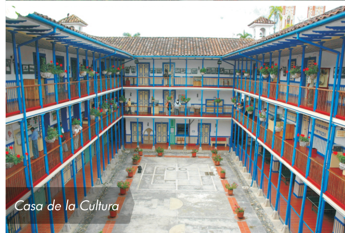
Casa de la Cultura