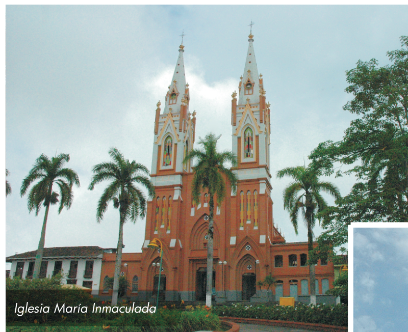
Iglesia María Inmaculada