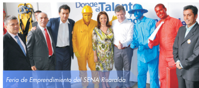
Feria de Emprendimiento del SENA Risaralda