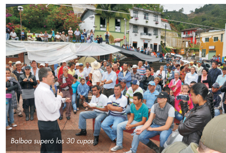
Balboa superó los 30 cupos

Cerca de 2.133 contratos se han previsto para Risaralda a través de la Secretaría de Planeación Departamental.