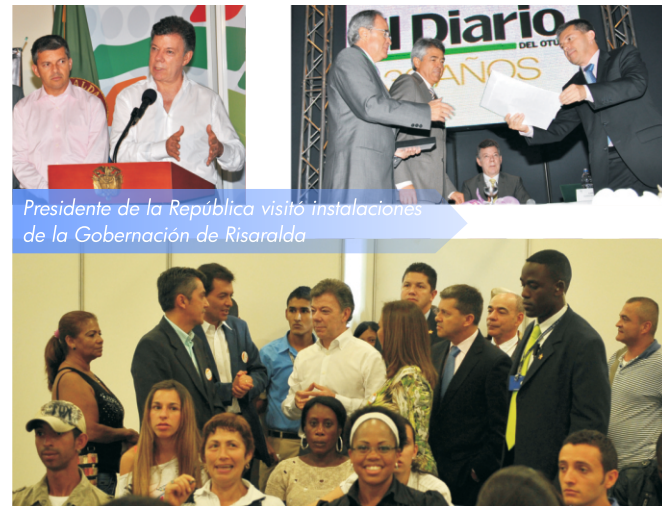
Presidente de la República visitó instalaciones de la Gobernación de Risaralda