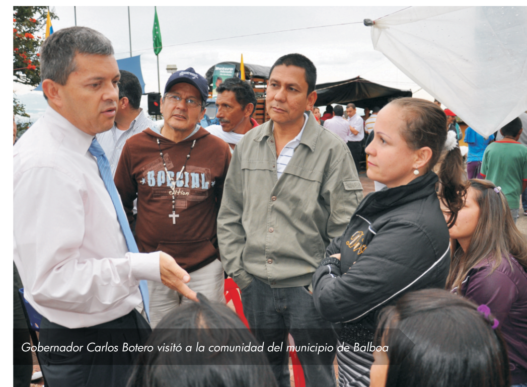
Gobernador Carlos Botero visitó a la comunidad del municipio de Balboa

Actualmente en Risaralda, se avanza en la contratación de los 1.220 pobladores que están entre los elegibles dándole paso al programa en el departamento.