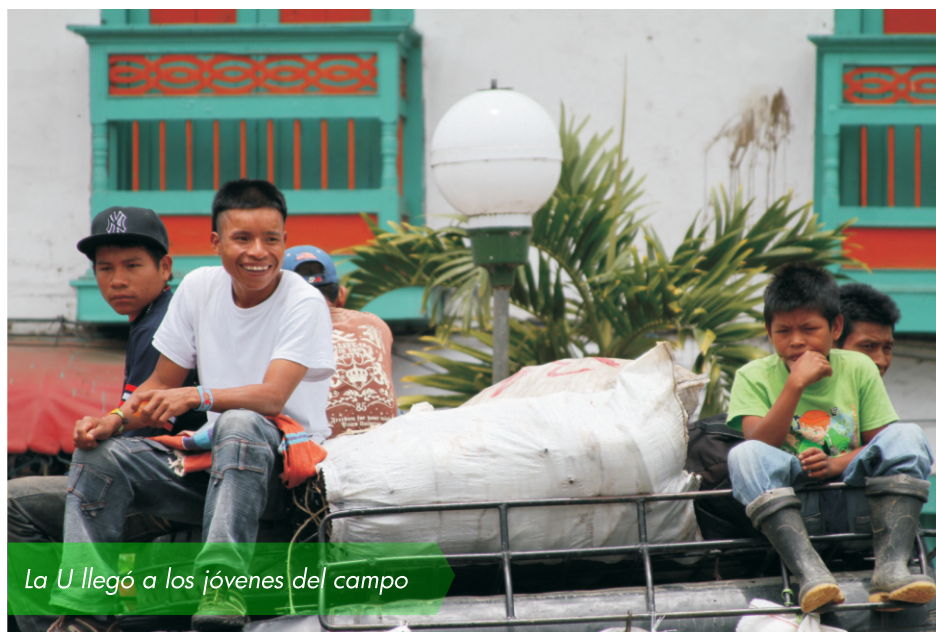
La U llegó a los jóvenes del campo

El objetivo central del proyecto educativo Universidad en el Campo, es aunar esfuerzos técnicos, administrativos, presupuestales y financieros, para acompañar a los establecimientos educativos de la zona rural del departamento de Risaralda, en el proceso de articulación de los niveles educativos comprendidos entre básica, media y el de la educación superior, beneficiando a 1.600 estudiante y 36 instituciones educativas.