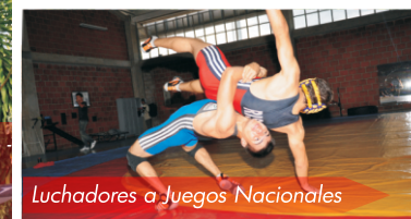
Luchadores a Juegos Nacionales

la Secretaría definió la participación en dieciocho eventos, entre competencias y concentraciones internacionales