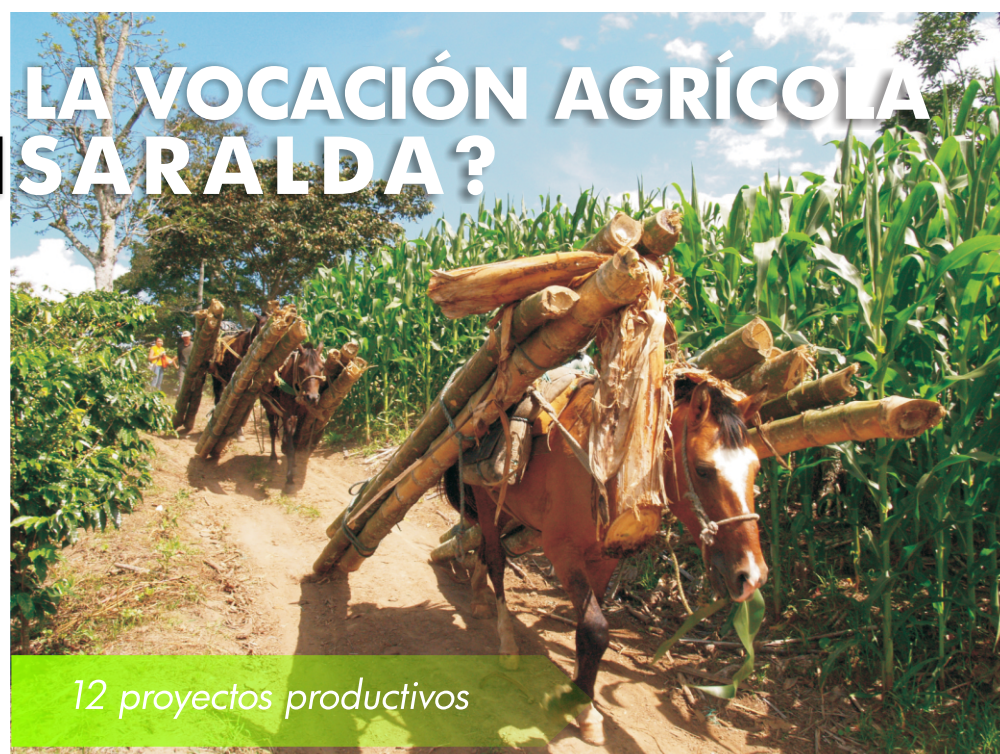
12 proyectos productivos

Paso 6: Aumentar a 700 el número de usuarios atendidos en los programas zoo y fitosanitario y participar en los procesos de certificación para lograr 592 hatos libres de brucella y tuberculosis.