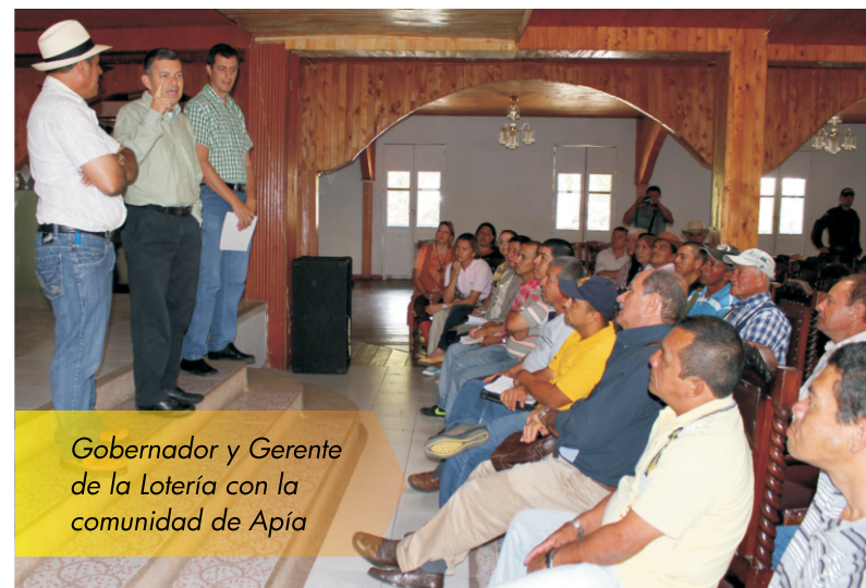
Gobernador y Gerente de la Lotería con la comunidad de Apia