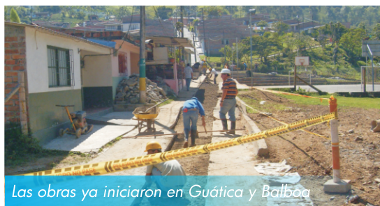
Las obras ya iniciaron en Guática y Balboa

Con el fin de incrementar los indicadores de calidad, continuidad, cobertura, y minimizar las pérdidas de agua en las áreas rurales y urbanas del departamento, La Gobernación de Risaralda está efectuando la normatividad vigente y garantizando el buen servicio a los usuarios.