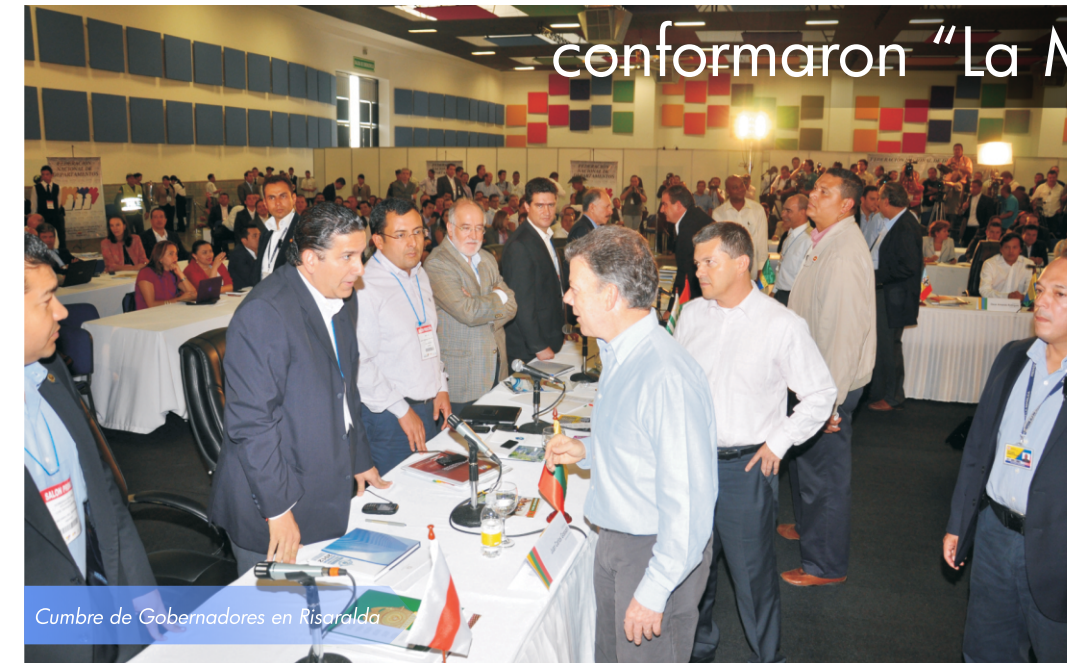
Cumbre de Gobernadores en Risaralda