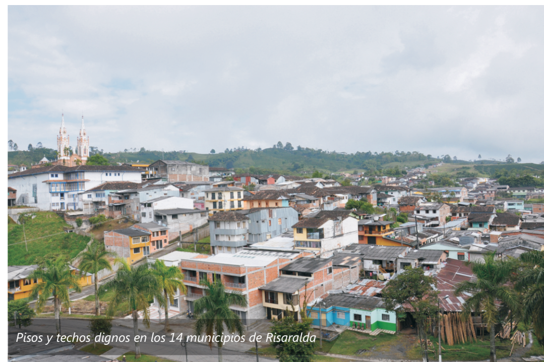
Pisos y techos dignos en los 14 municipios de Risaralda

En estos cuatro años, la Gobernación de Risaralda construirá 1.300 nuevas soluciones habitacionales y 3.000 mejoramientos de vivienda, para contribuir a elevar la calidad de vida de las familias de menores ingresos. Así ha quedado consignado en el Plan de Desarrollo 2012 - 2015 "Risaralda Unida, Incluyente y con Resultados".