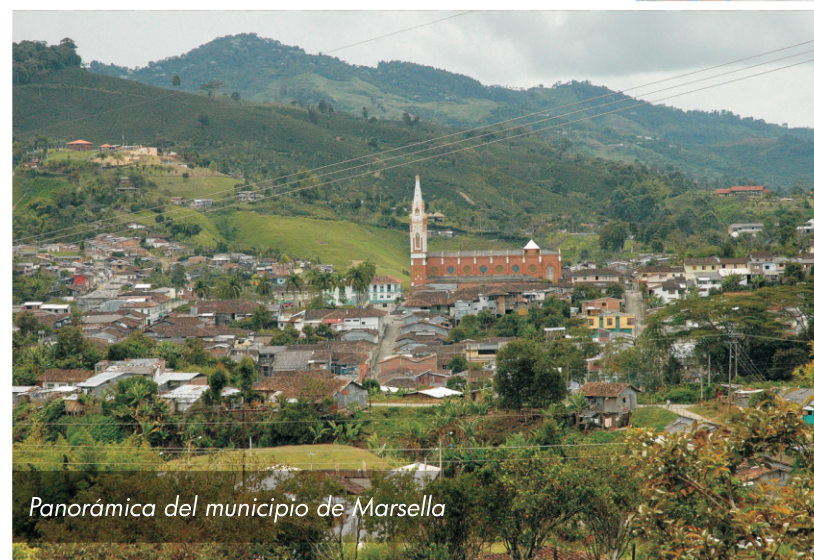
Panorámica del municipio de Marsella