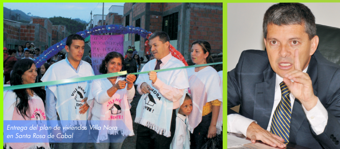
Entrega del plan de viviendas Villa Nora en Santa Rosa de Cabal