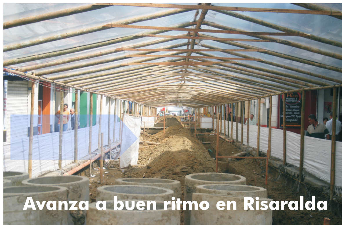
Avanza a buen ritmo en Risaralda

Con el fin de incrementar los indicadores de calidad, continuidad, cobertura, y minimizar las pérdidas de agua en las áreas rurales y urbanas del departamento, La Gobernación de Risaralda está efectuando la normatividad vigente y garantizando el buen servicio a los usuarios.