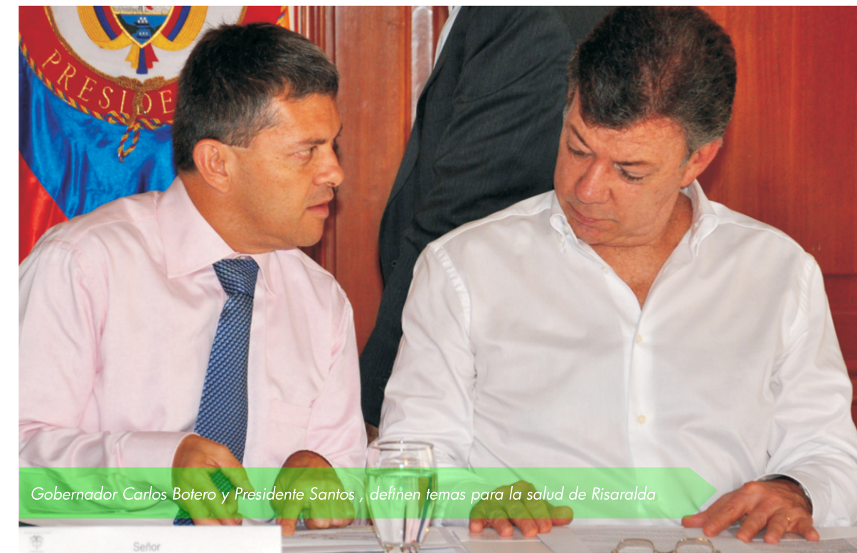
Gobernador Carlos Botero y Presidente Santos, definen temas para la salud de Risaralda

"El sistema hace rato dejó de estar en crisis. Ahora simplemente es inviable", afirmó el presidente de la Federación Médica Colombiana, Sergio Isaza, refiriéndose a la solicitud que formularon los médicos del país.