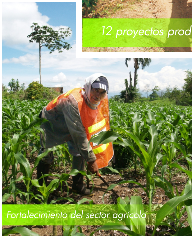
Fortalecimiento del sector agrícola

Paso 7: Implementar 5 proyectos de impacto ambiental en la zona rural del Departamento de Risaralda.