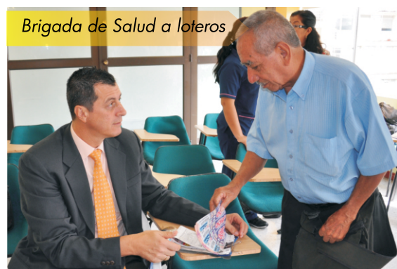
Brigada de Salud a loteros

$1.900 millones en premios a sus compradores entrega cada año la Lotería del Risaralda a través del juego del Súper Chance, que ahora representa más oportunidades para ganar.