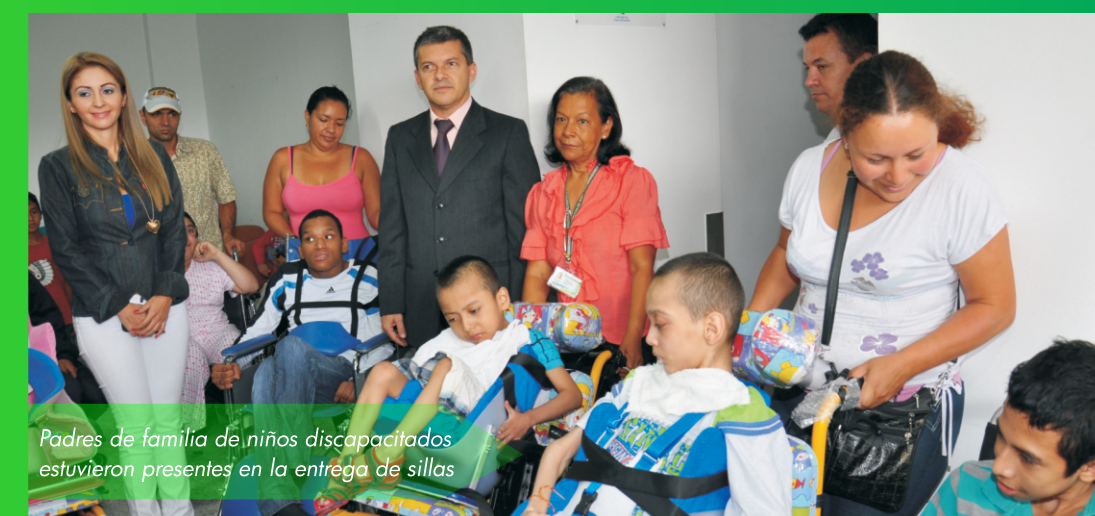
Padres de familia de niños discapacitados estuvieron presentes en la entrega de sillas

El costo del proyecto es de $300 millones así: $250 millones se gestionaron ante el Ministerio de Salud y $50 millones los aporta la Gobernación.