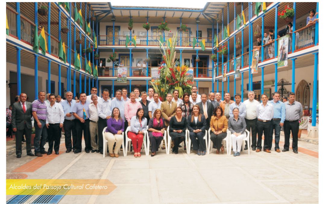
Alcaldes del Paisaje Cultural Cafetero

Se logró conformar la Asociación de Alcaldes del PCC, presidida por el municipio de Marsella y se firmó la Declaratoria en Marsella comprometiendo a los alcaldes al Plan de Manejo del PCC.