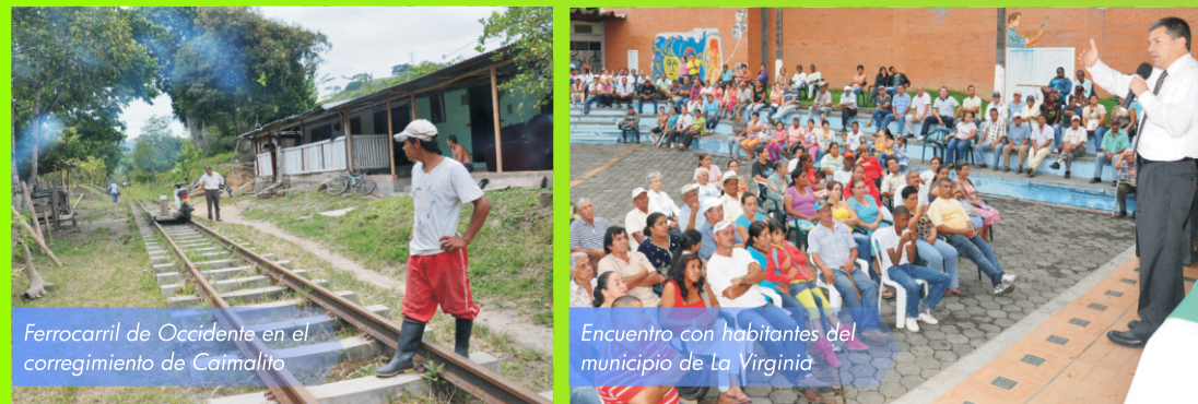
Ferrocarril de Occidente en el corregimiento de Caimalito