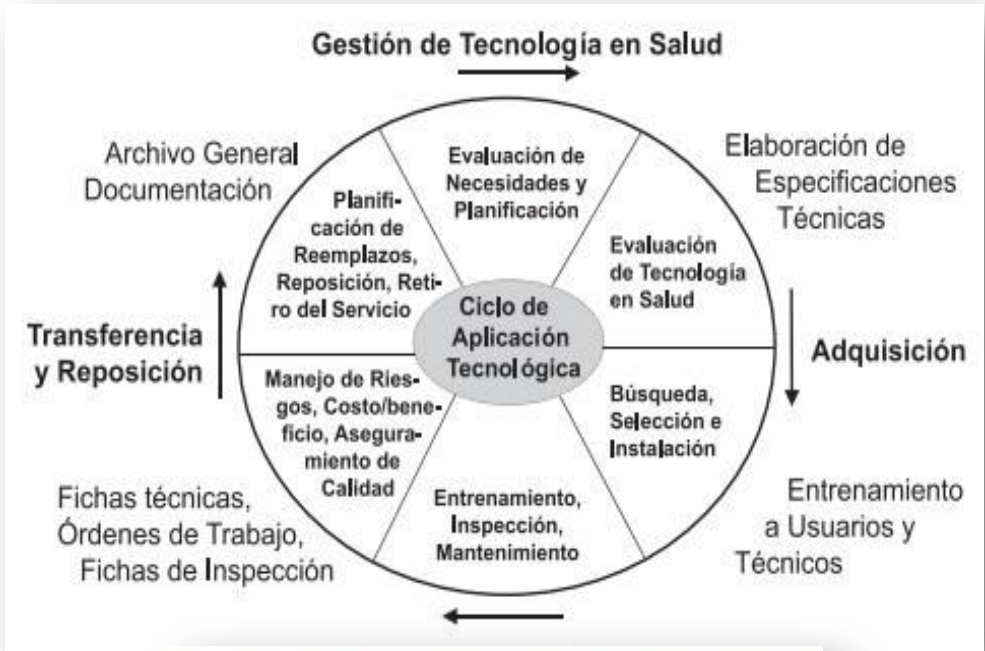
Fig. 2.3 Ciclo de Aplicación de la Tecnología en Salud [modificado de Lara, L. y Poluta, M.]